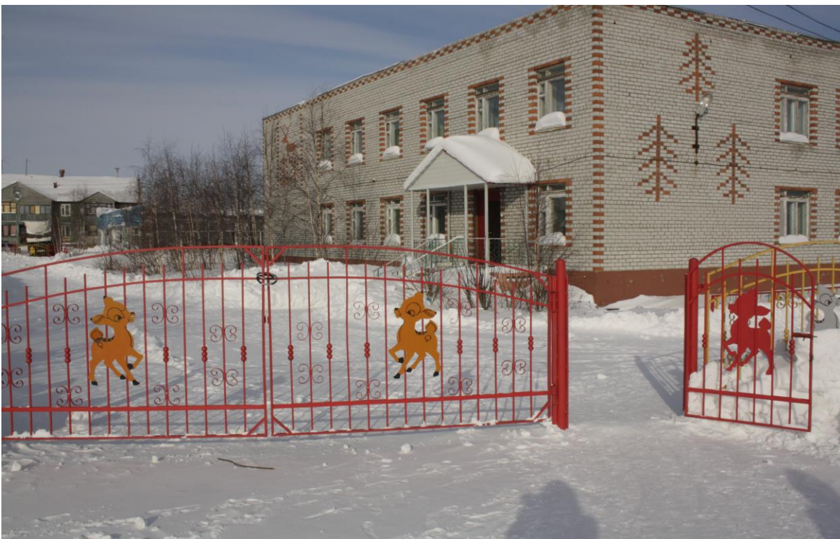
Ворота, калитка с Южной стороны.