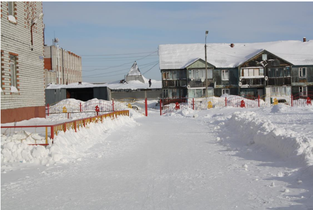
Западная калитка на Таежную улицу.