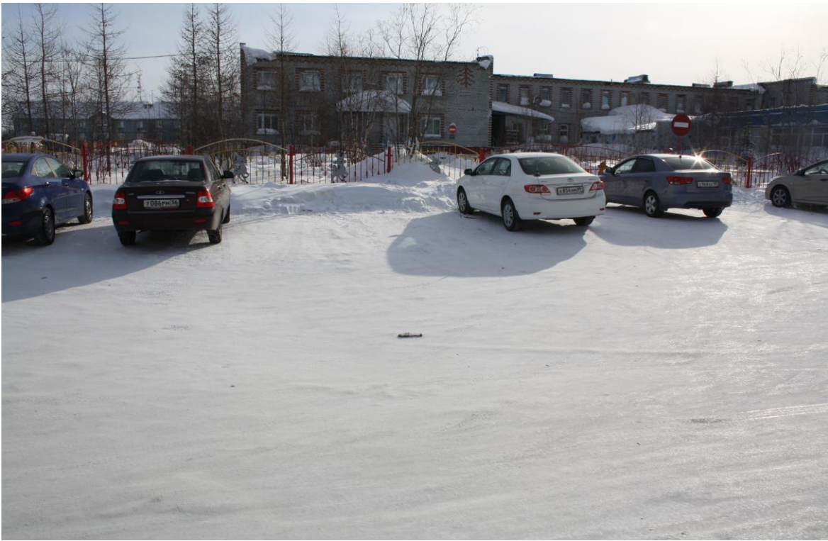
Северная сторона проезжая часть по ул. Таежная