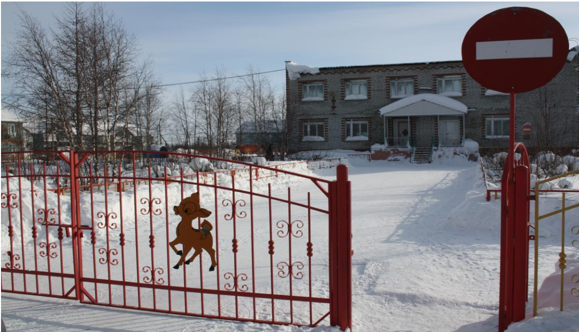
Ворота, калитка с Северной стороны.